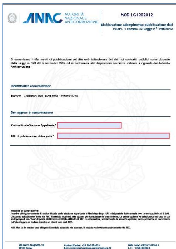
Figura 1 - Esempio di modulo PDF per la dichiarazione di adempimento

E' mostrata di seguito un'immagine con il modulo PDF da utilizzare per la comunicazione: